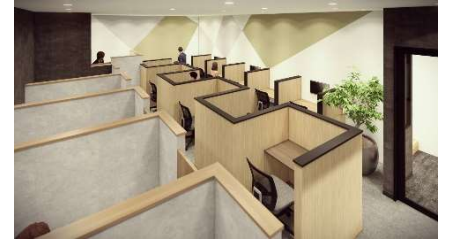
ワークスペース イメージ

当施設は、春日部駅から徒歩3分と好立地な上、24時間365日利用できます。日中のテレワークはもちろん、出勤前の朝活や、仕事終わりの自習時間など、自身のライフスタイルに合わせて、いつでも自由に使えます。