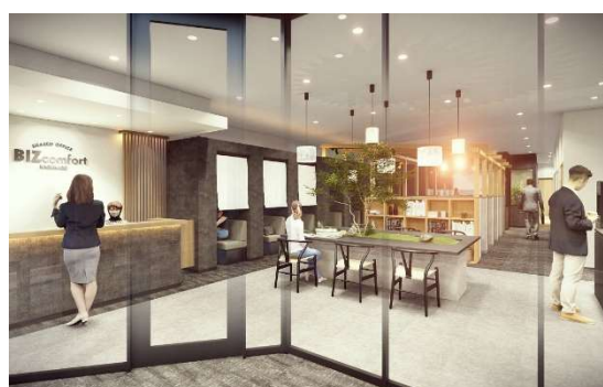
BIZcomfort 春日部 イメージ

春日部市は、駅前に商業施設が充実しながら、自然と街が共存している落ち着いた雰囲気が魅力の街です。住むための街としての魅力が強いこともあるためか、春日部近郊には、シェアオフィスの出店が少ないという現状がありました。自宅と職場の距離の近い働き方“職住近接”を応援する当社は、自宅環境が万全ではないため快適なテレワークを行えない人や、自宅周辺にテレワーカー向けのスペースがなく都心部へ通勤をする人々などをサポートし、多様なライフスタイルや働き方を実現できるよう、春日部にシェアオフィスをオープンすることを決めました。