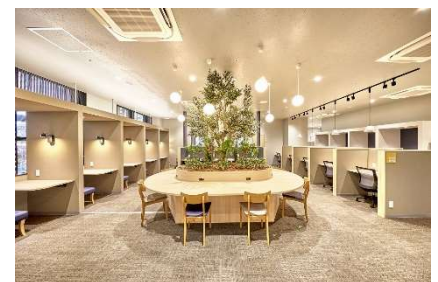
埼玉エリア コワーキングスペース

月額15,400円（税込）で埼玉にある6拠点※3のBIZcomfortが24時間いつでも使い放題のプランを用意しています。埼玉エリア間で移動が多い方、クライアントとの打ち合わせ場所や用途が日によって変わる方は、お好きな拠点を選べるため「埼玉プラン」がおすすめです。※3 2023年7月時点