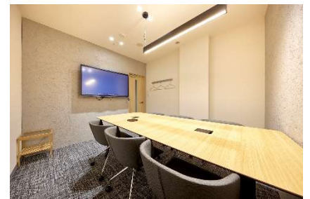
6名用会議室 イメージ

打ち合わせに便利な6名用の会議室※2もあり、チームミーティングやクライアントとの商談などに使えます。WEB会議や通話専用のテレフォンブース※2は個室のため、カフェや自宅で回りが気になる方にも安心していただけます。リモート会議やオンライン面接の場にも便利です。※2 予約制・有料